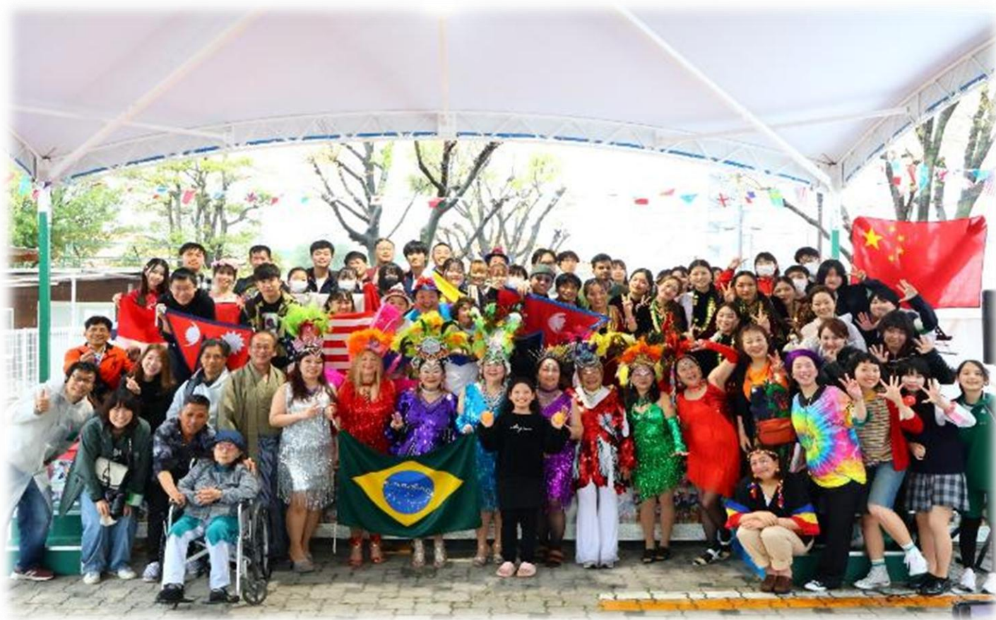
▲国際交流フェスタ「わいわい春まつり」