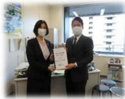
▲関係省庁への提言 (左写真／総務省、右写真／経済産業省)