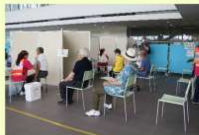
外国人の集団接種