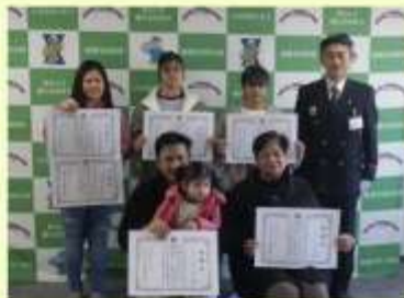
消火協力者への感謝状贈呈 (R4.1)