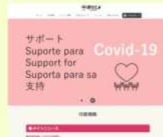
外国人市民向け情報サイト 「ぼけとよ」

予診票の翻訳と記入サポート、各種お知らせの翻訳、ワクチン接種の予約、当日接種の通訳対応などを実施