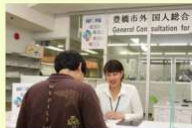
外国人総合相談窓口インフォピア