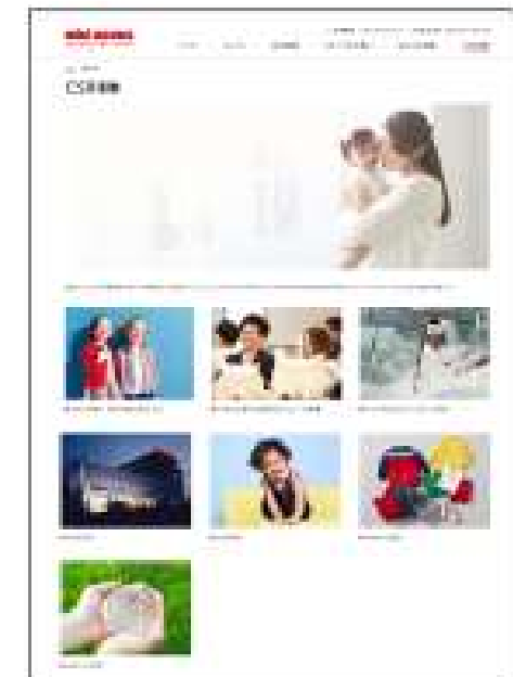
当社HP「CSR調達活動」ページ

グループの「CSR調達ガイドライン」を策定 HPに「CSR調達」ページを新設、開示 （2017年8月～9月）