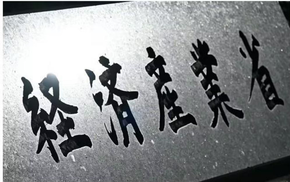
経済産業省が設けた人権指針の検討会は国際機関や弁護士、学者などで構成する

https://www.nikkei.com/article/DGXZQOQA091M10Z00C22A300000/