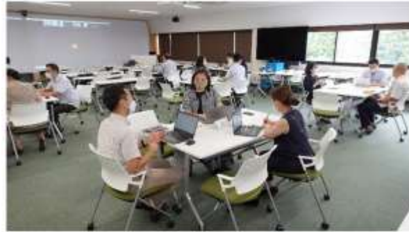
【参加者同士で議論を重ねアクションプランの作成】