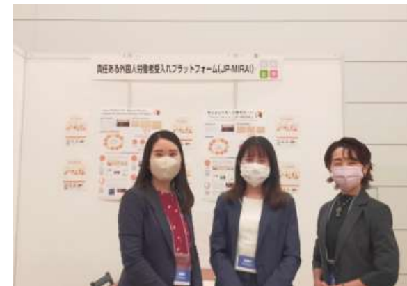
11月25、26日国際ナショナルジョブ フェア東京2022のブースに出展