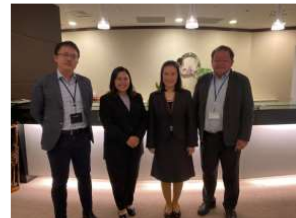
8月8日 在京タイ大使館 公使・参事官(労働担当)との面談