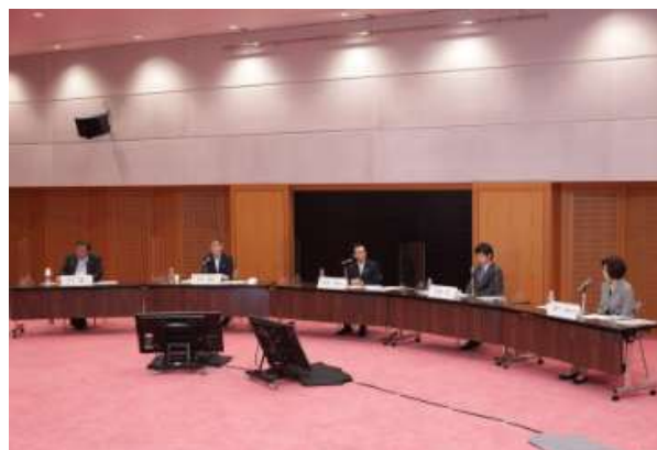
8月10日 「『選ばれる国』になるために -共生社会実現へのアジェンダ」(経団連・ JCIE・JICA 共催、JP-MIRAI後援)に ててJP-MIRAIの取り組みを報告