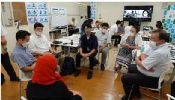
【宮崎のIT企業で働くB-JET卒業生との意見交換】