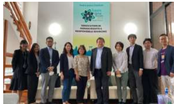
6月27日 ISSARA Institute訪問